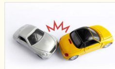
交通事故・むち打ち