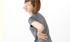
腰痛・ぎっくり腰